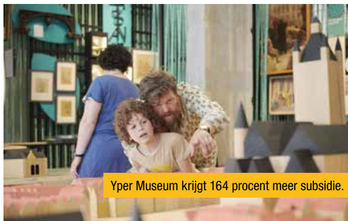
Yper Museum krijgt 164 procent meer subsidie.

De subsidies voor het In Flanders Fields Museum stijgen met 47 procent. Qua bezoekers vertoonde het In Flanders Fields Museum de sterkste stijging. Maar liefst 168.054 mensen bezochten vorig jaar het museum. Dat is een stijging met 25,5 procent in vergelijking met 2022. Daarmee bevestigt het In Flanders Fields Museum zijn rol als hét startpunt voor een bezoek aan de Stad Ieper en de streek in het kader van de Eerste Wereldoorlog.