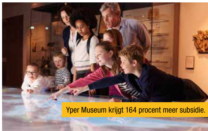
Yper Museum krijgt 164 procent meer subsidie.

De subsidies voor het In Flanders Fields Museum stijgen met 47 procent. Qua bezoekers vertoonde het In Flanders Fields Museum de sterkste stijging. Maar liefst 168.054 mensen bezochten vorig jaar het museum. Dat is een stijging met 25,5 procent in vergelijking met 2022. Daarmee bevestigt het In Flanders Fields Museum zijn rol als hét startpunt voor een bezoek aan de Stad Ieper en de streek in het kader van de Eerste Wereldoorlog.