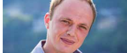
Bestuursleden in de kijker p. 3