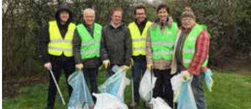
N-VA Ieper in beeld p. 2